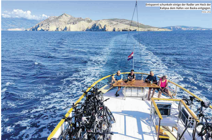
Entspannt schunkeln einige der Radler am Heck der Kalipsa dem Hafen von Baska entgegen.