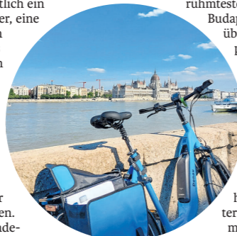
Per Rad durch Budapest, im Hintergrund das Parlamentsgebäude.